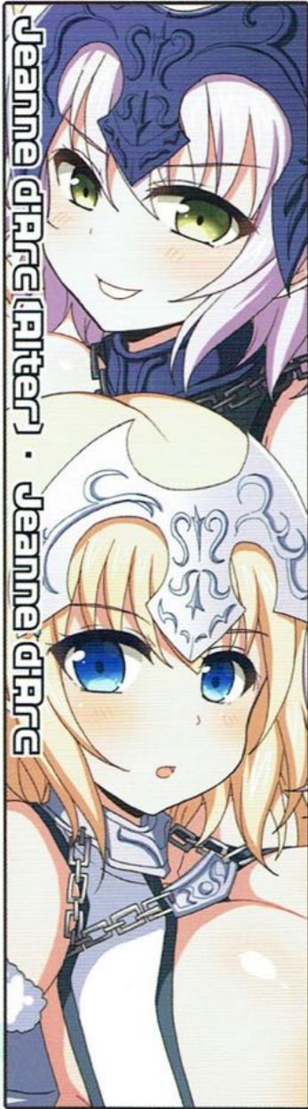
Jeanna d'Arc (Alter) · Jeanna d'Arc